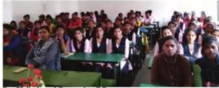
विद्यार्थियों को सम्बोधित करते अतिथि

जैसे विषय में कैरियर बनाने के संबंध में जानकारी दी। कार्यक्रम की अध्यक्षता कर रहे