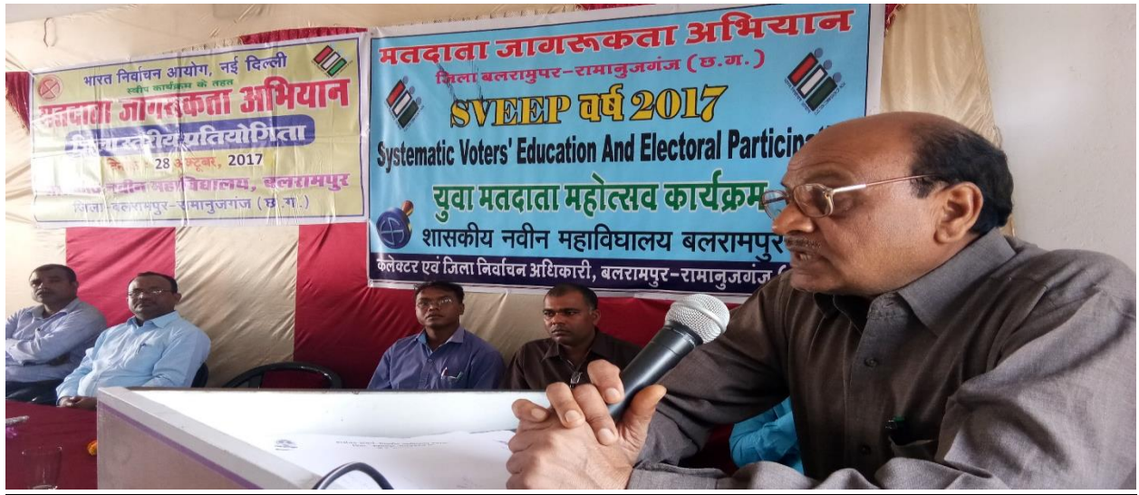
Address of district Deputy election officer to students (28/11/17)