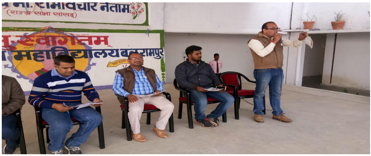
Date - (28/10/2017)