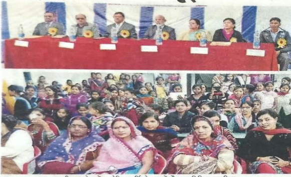
नवीन कॉलेज में आयोजित वार्षिकोत्सव में मौजूद अतिथि व नागरिक